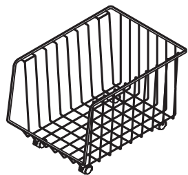
A キャスター付バスケット×1